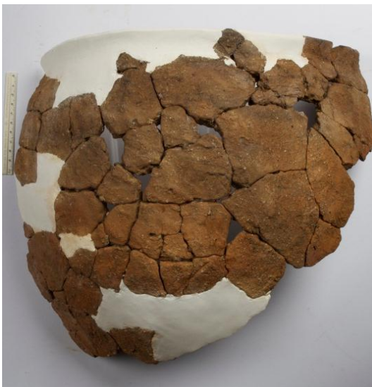
Goldach Mühlegut SG, Topf (rekon- struiert), Mittelbronzezeit, KASG