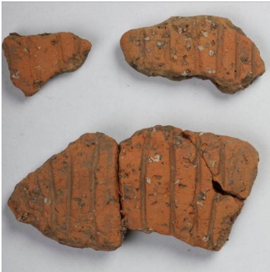
Goldach Mühlegut SG, Wandfrag- mente eines Topfs, mit parallelen Rillen, Mittelbronzezeit, KASG