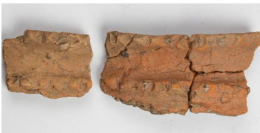
Goldach Mühlegut SG, Randfrag- mente eines Topf (?) mit zwei Fingertupfenleisten, Mittelbronze- zeit, KASG